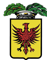
Provincia di Ravenna